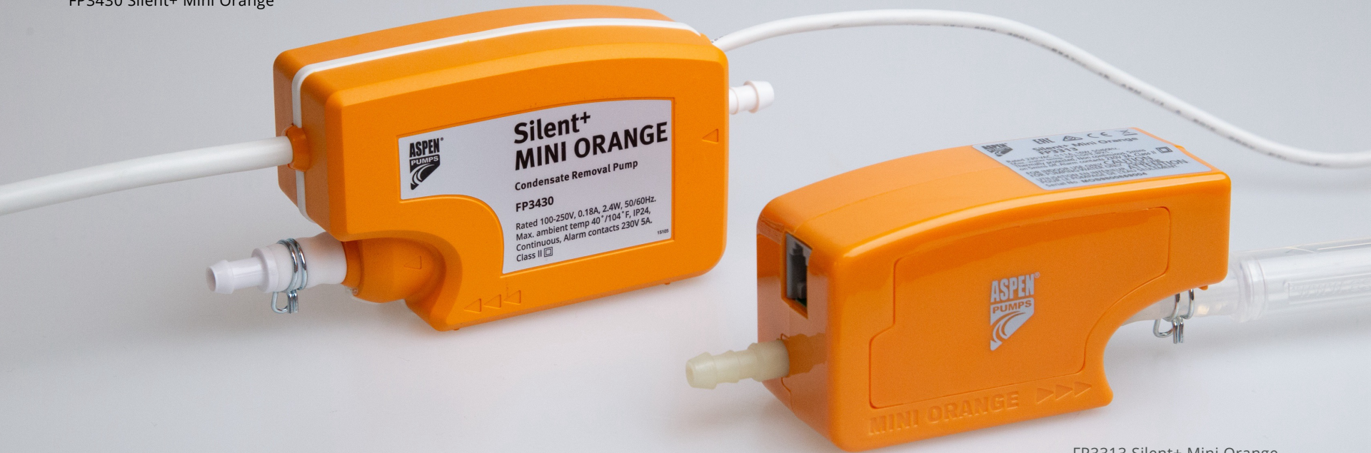
FP3313 Silent+ Mini Orange

Ultraleise 16 dB(A)* und bis zu 35 l/h Durchflussmenge!