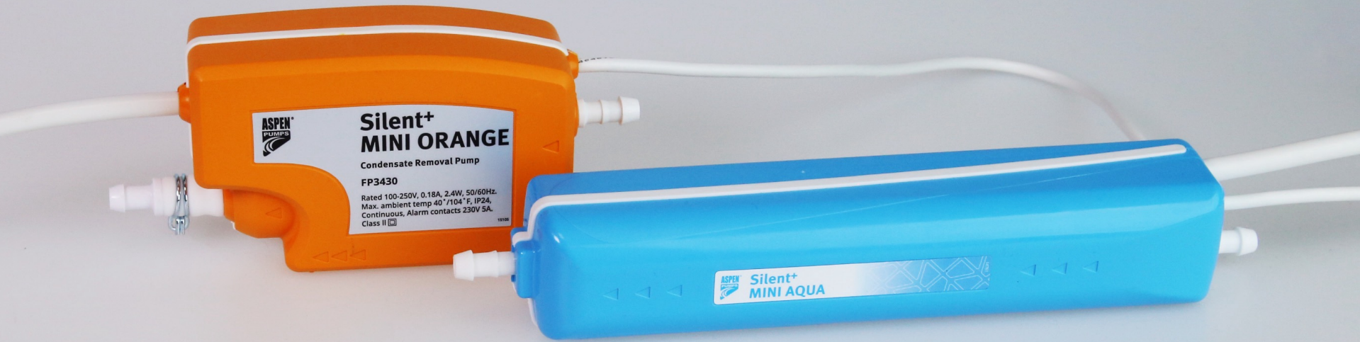
FP3420 Silent+ Mini Aqua