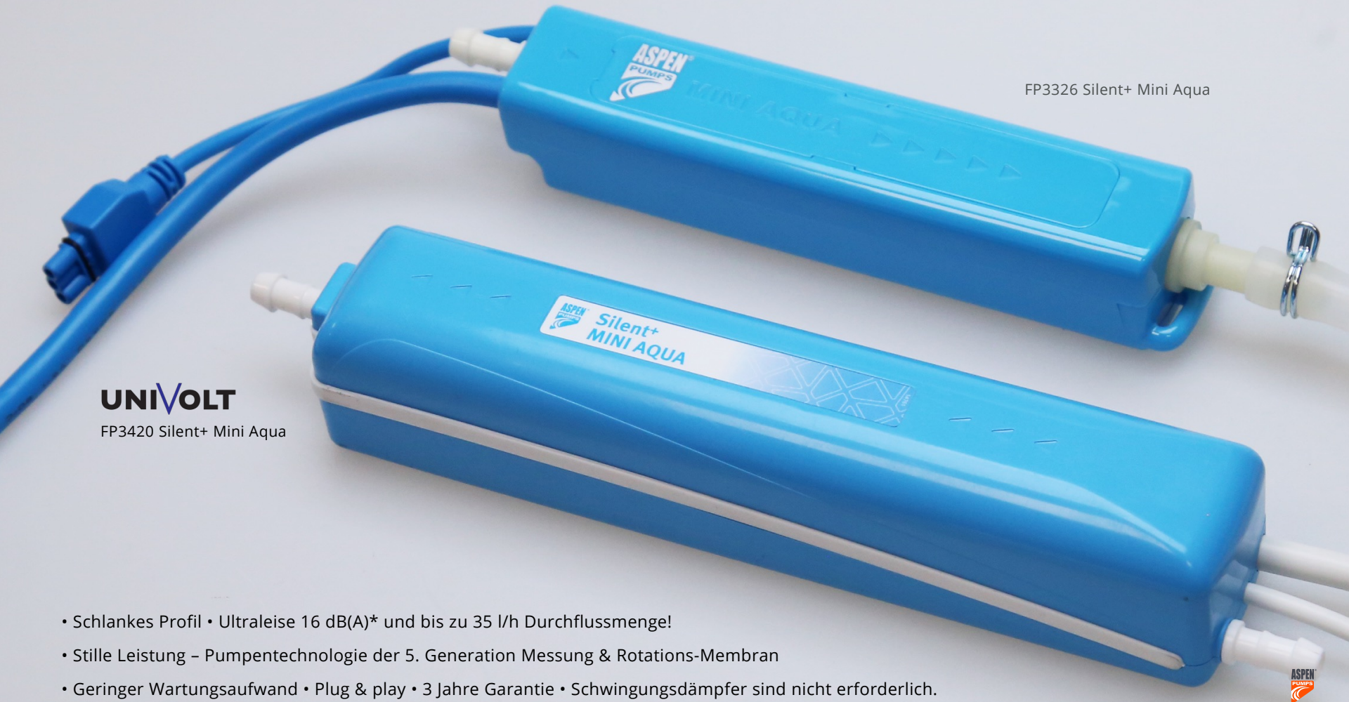
FP3326 Silent+ Mini Aqua