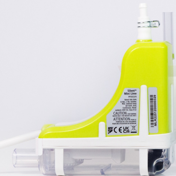
Silent+ Mini Lime FP3312/5, FP3319/5, FP3323/5, FP3325/5, FP3324/5, FP3327/5, FP3320/5, FP3321/5, FP3322/5 (Ersatzpackung)