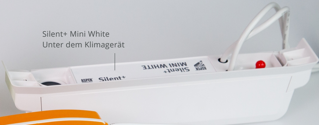
Silent+ Mini White Unter dem Klimagerät