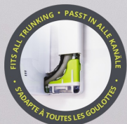
Silent+ Mini Lime Im Eckkanal