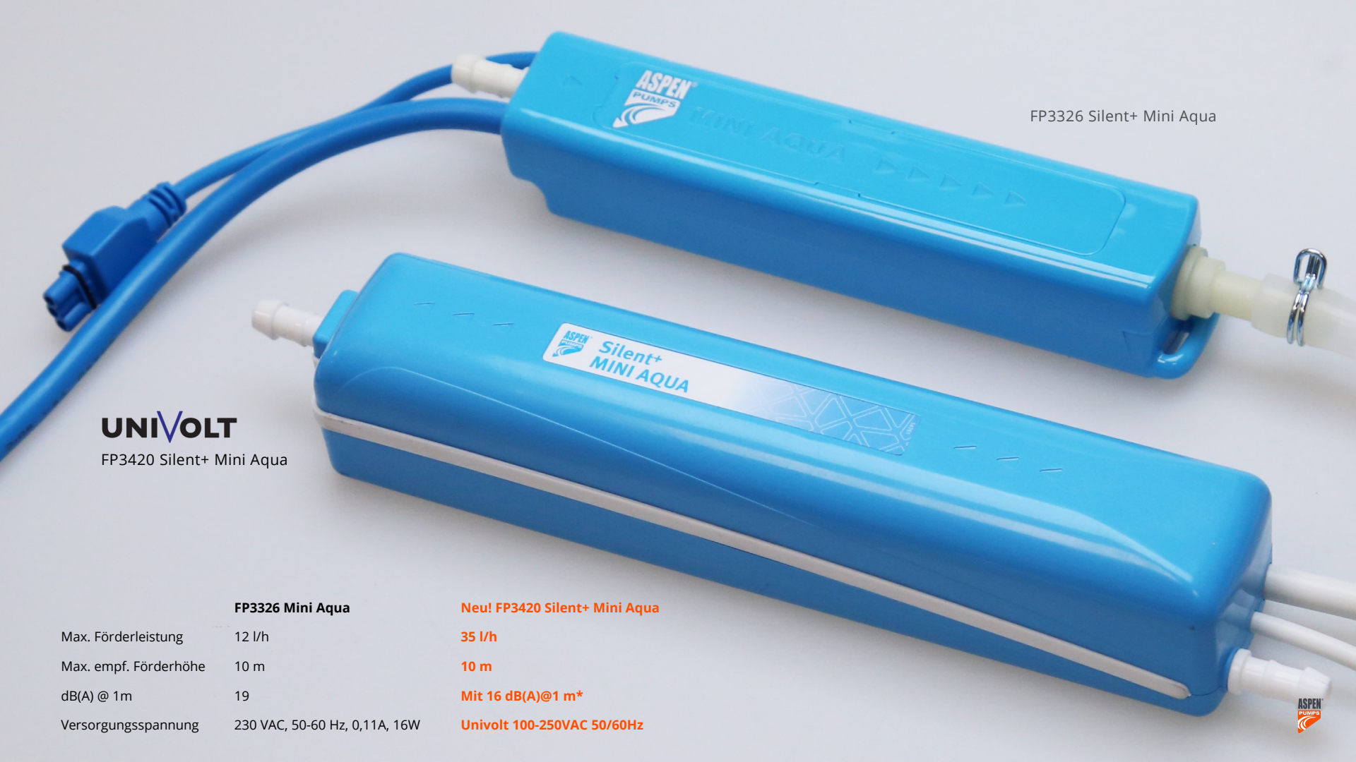
FP3326 Silent+ Mini Aqua